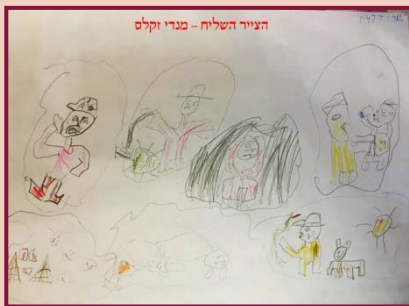
בערוש קופמן, כיתה ג'